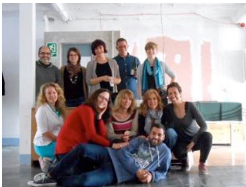
Taller de certificación de la 1ª Edición, Abril 2015

Y lo mejor: Todas estas ofertas están incluidas en el precio del curriculum!